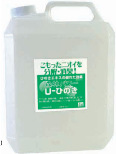
森林パワー U-ひのき 詰替用 4L