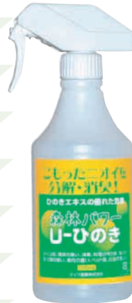
森林パワー U-ひのき 500ml (専用スプレー)