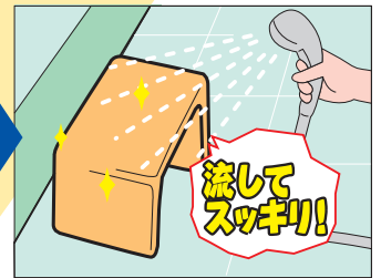
シャワーでサッと流すだけ

スキットテンが置かれている大浴場では、 女性客の90%、男性客の75%以上が 使用され、好評をいただいています。