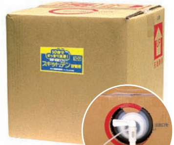
コック付き 詰替え用10ℓ容器 (約3,500人分)